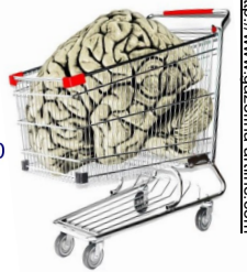
http://www.gazolina.com © GAZOLINA

28-30 rue des 3 Cailloux Vendredi 18 Mars et Samedi 19 Mars dès 13h00